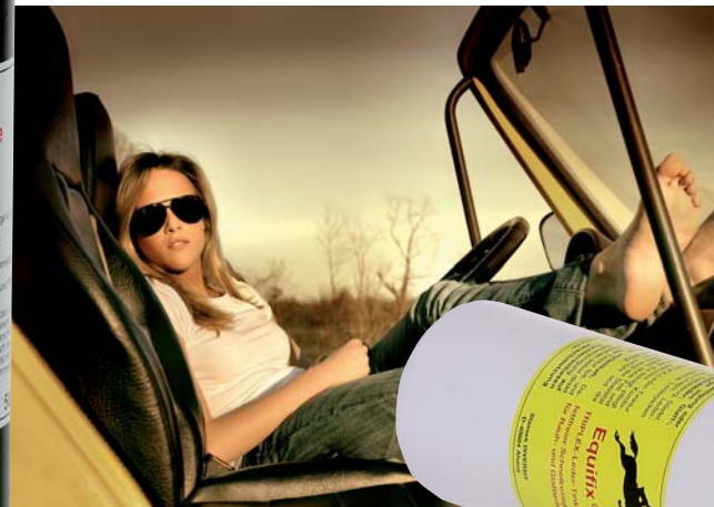
Tailles disponibles: 500 ml

Appliquer au cuir à l'aide du vaporisateur ou d'un chiffon mollet. Laisser agir brièvement et puis torchonn