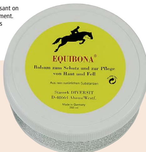
Tailles disponibles: boîte à couvercle fileté 250 ml

Appliquer Equibona® sur la peau et masser doucement si nécessaire. Parce que EQUIBONA est extrêmement bienfaisant on peut l'appliquer même sur des lésions cutanées par frottement. Grâce à une couche riche d'Equibona® sur ces endroits les insectes ne peuvent plus se poser sur la peau irritée.