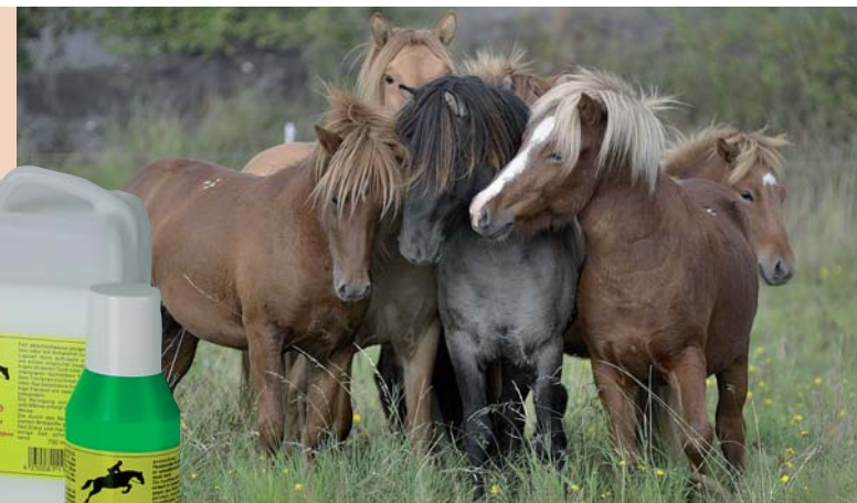
Tailles disponibles: 500 ml - 2 l - 5 l - 10 l

Mode d'emploi: Equiclean® PLEIN AIR & PEAU SENSITIVE comme un shampooing habituel. Masser un instant et puis rincer à fond.