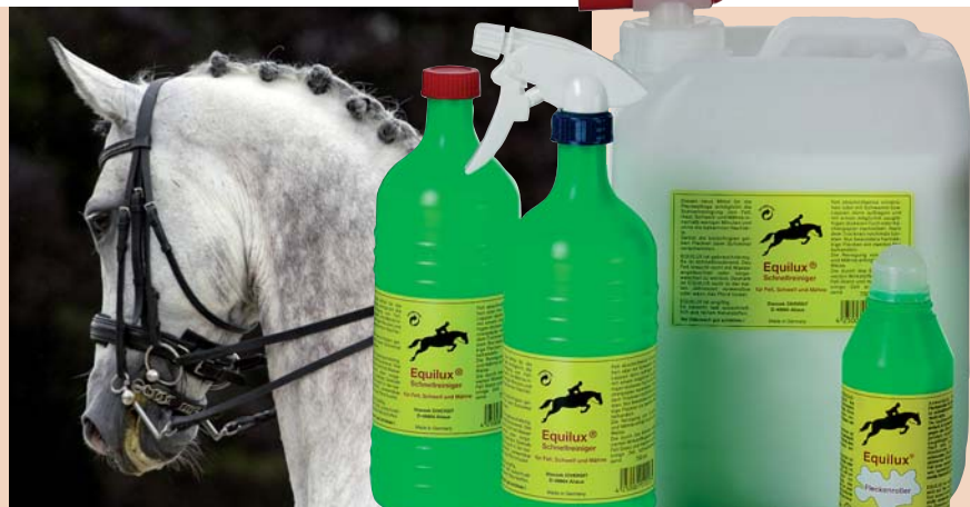
Tailles disponibles: 250 ml - 750 ml - 2 l - 5 l - 10 l

Ce n'est pas nécessaire de mouiller la robe avec de l'eau. Equilux® est prêt à l'emploi. Vaporiser (ou appliquer à l'aide d'une éponge) successivement sur les zones de la robe sèche et préalablement nettoyée. Puis frotter brièvement avec un chiffon absorbant ou un Kleenex. En cas des taches les plus résistantes faire encore une fois. Après le séchage donner quelques coups de bouchon de chiendent et la tache est enlevée. Faire le même pour le nettoyage de la crinière et de la queue.