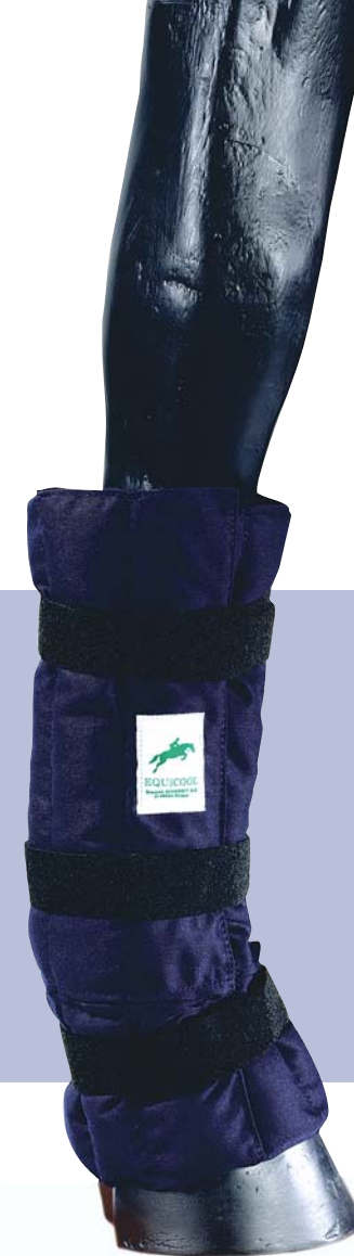
Modèle de Luxe